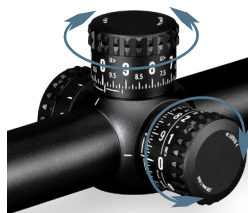
Rueda de la torreta de deriva