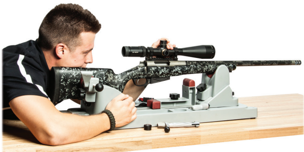
Colimación visual del ánima del arma con la mira.