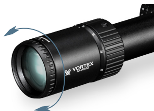
Ajuste el enfoque de la retícula

Una vez realizado este ajuste, ya no tendrá que volver a enfocar la mira cada vez que la utilice. No obstante, y dado que la vista de una persona puede cambiar con el paso del tiempo, es aconsejable volver a comprobar este ajuste de manera periódica.