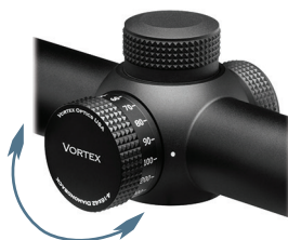
Ajuste el control de enfoque lateral

El paralaje es un fenómeno que se produce cuando la imagen a la que se dirige la vista no queda en el mismo plano óptico que la retícula situada en el interior de la mira telescópica. Si el ojo del tirador no está centrado de forma precisa en el ocular, puede producirse un desplazamiento aparente del blanco con respecto a la retícula, lo que puede, a su vez, causar un ligero desplazamiento en el punto de disparo. El mayor problema de los errores de paralaje se produce con tiradores de precisión que utilizan muchos aumentos.