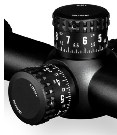
Ajustes en MOA 1 clic = 1/8 de MOA

Las medidas de arco en MOA utilizan grados y minutos. Un ángulo de un minuto se representa con una subtensión de 29,1 mm a una distancia de 100 metros (1,05 pulgadas a 100 yardas). Esta mira telescópica utiliza pasos de 1/8 minutos, que muestran una subtensión de 3,6 mm a 100 metros (0,13 pulgadas a 100 yardas), 7,2 mm a 200 metros (0,26 pulgadas a 200 yardas), 10,8 mm a 300 metros (0,39 pulgadas a 300 yardas), y así sucesivamente.